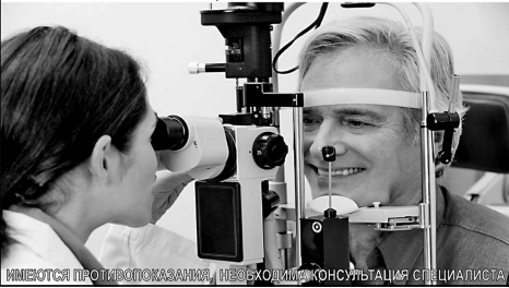
ИМЕЮТСЯ ПРОТИВОПОКАЗАНИЯ, НЕОБХОДИМА КОНСУЛЬТАЦИЯ СПЕЦИАЛИСТА