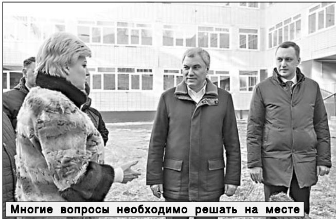
Многие вопросы необходимо решать на месте

В Саратове в исследовательском центре кластерной онкологии при СГМУ им. В.И. Разумовского заработал един-