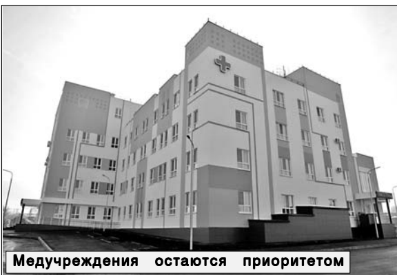
Медучреждения остаются приоритетом

С нового года планируется, что саратовская школа №103 в Ленинском районе также перейдет на односменное обучение: завершается возведение нового корпуса на 275 ученических мест. ➔