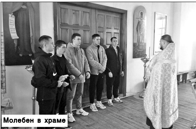
Молебен в храме