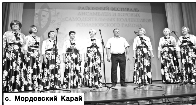
с. Мордовский Карай