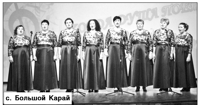
с. Большой Карай