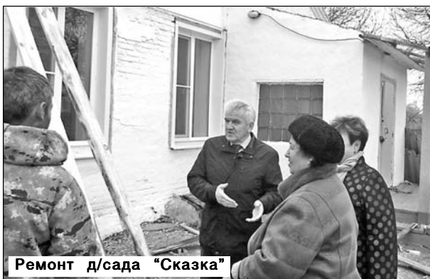
Ремонт д/сада «Сказка»