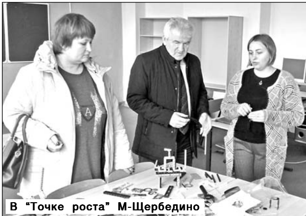
В «Точке роста» М-Щербедино

В рамках федерального проекта «Современная школа» новый центр «Точка роста» появится теперь в Краснотиманской школе.