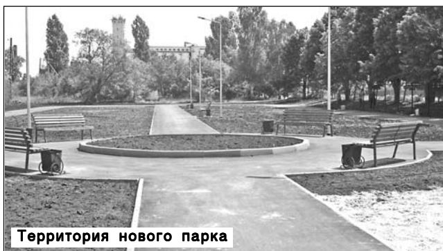
Территория нового парка

Также за счет средств местного бюджета - 2 млн рублей - проведена реконструкция центрального участка водопровода в Романовке. ➔