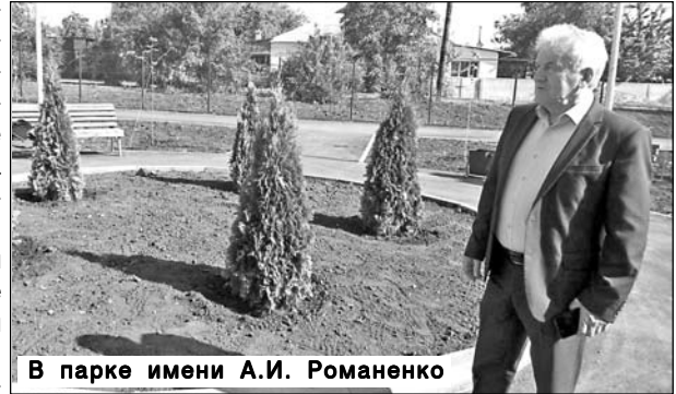
В парке имени А.И. Романенко

- В 2023 году в рамках программы «Культура Саратовской области» был отремонтирован Осиновский СДК. Было выделено более 1,7 млн бюджетных средств, помогли средства спонсоров – глав КФХ. В результате получилось сделать сельский ДК