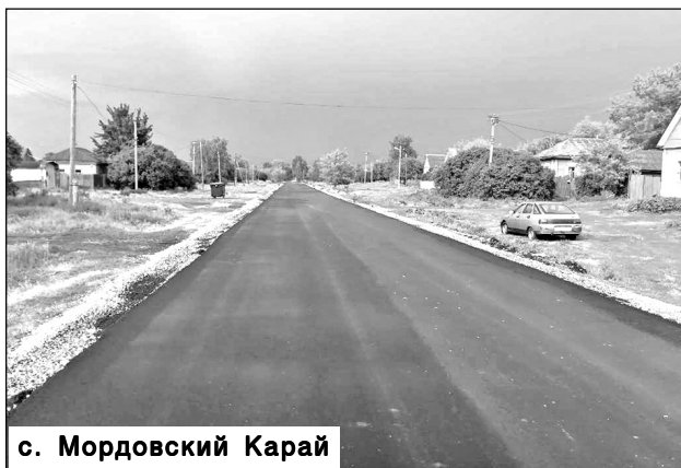
с. Мордовский Карай