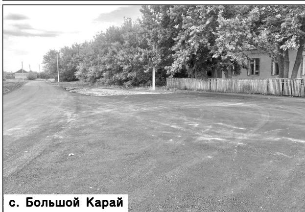
с. Большой Карай

В рамках государственной программы Саратовской области «Развитие транспортной системы» выделена субсидия на осуществление дорожной деятельности в отношении автомобильных дорог общего пользования местного значения в границах населенных пунктов сельских поселений.