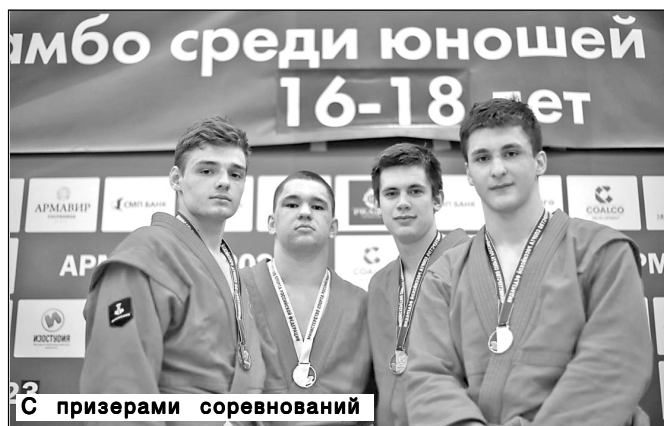
С призерами соревнований