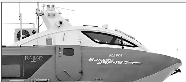
Совместный проект с Саратовской областной газетой «Регион 64».

Добавим, что для Саратовской области предусмотрено федеральное финансирование на возмещение большей части затрат на приобретение пяти «Валдаев».