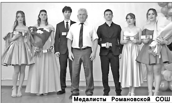
Медалисты Романовской СОШ

Поздравляем всех педагогов, родителей и ребят, конечно же, с этими результатами.