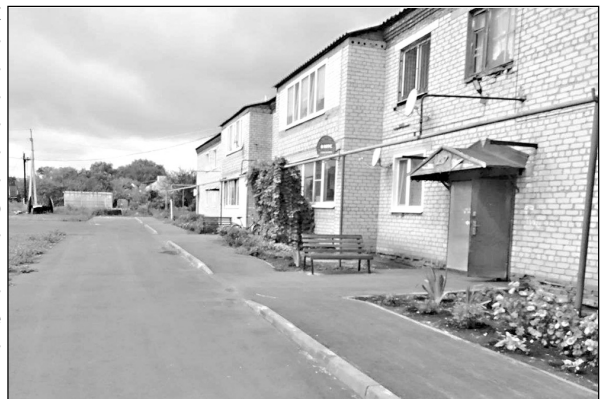
Двор ул. Мира, 2а

По программе «Комфортная городская среда» будут сделаны: дворовая территория по ул. Шевченко, д. 215 в р.п. Романовка и общественная - прилегающая к комплексу зданий по ул. Советской, д.128 (ДШИ, управление образования, УСПН). Будет продолжено строительство тротуаров по ул. Калинина, частично в пер. Пионер-