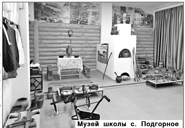
Музей школы с. Подгорное