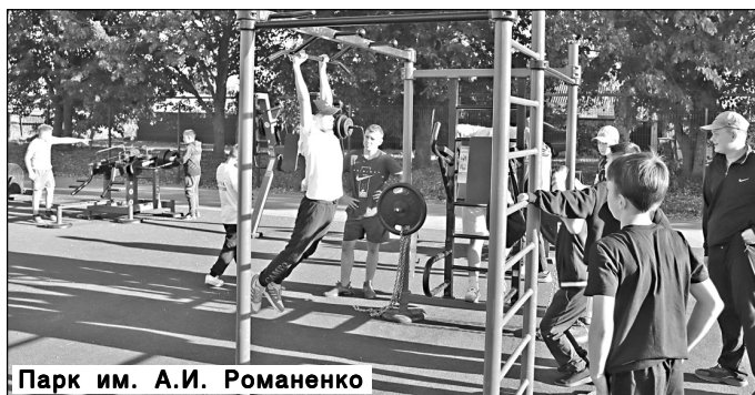
Парк им. А.И. Романенко

- В 2024 году по нацпроекту «Образование» в филиале Романовской школы в п. Красноармейский открыт восьмой по счету в районе центр естественно-научной направленности «Точка роста». Приобретено оборудование по направлениям: физика, химия, биология, экология. Реализуется региональный проект «Развитие инфраструктуры образовательных организаций области, более известный как ремонт 100 школ и 100 детских садов. В рамках его заменены почти все окна в Романовской школе (186 шт.), в филиале школы в с. М-Щербедино заменены 18 оконных блоков и установлена металлическая дверь. В Романовке также отремонтирован один школьный спортзал (установлены дверные и оконные блоки, новое освещение, выравнивание стен, покраска). Проведены ремонты в детских садах: «Надежда» с. Большой Карай (стены, освещение, оконные и дверные блоки, новое сантехническое оборудование, ремонт в пищеблоке), в детском саду «Искорка» п. Алексеевский (перекрыта крыша здания, новые оконные и дверные блоки, частичный ремонт пола, проведена канализация и установлена сантехника, выполнен внутренний ремонт помещения). ➔