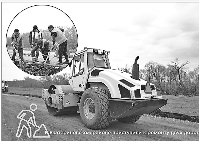
В Екатериновском районе приступили к ремонту двух дорог

Всего в этом году по нацпроекту «Безопасные качественные дороги» планируется привести в нормативное состояние 320 км трасс и 13 мостов и путепроводов.