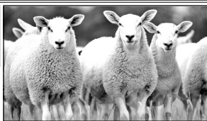
Обязательно наличие ветеринарных сопроводительных документов.

Телефоны: 8-920-487-92-43, 8-909-233-27-27.