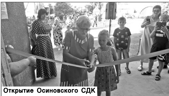
Открытие Осиновского СДК