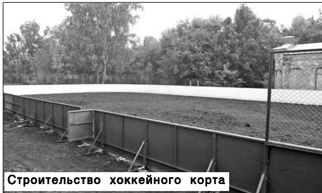
Строительство хоккейного корта

инфраструктуры образовательных организаций». Жителям он известен как проект «Ремонт 100 школ, 100 детсадов и 100 спортзалов». Отремонтированы: Большекарайская СОШ более чем на 2,5 млн рублей (крыля, входная группа), Искровская СОШ на сумму около 500 тыс. рублей (замена окон, внутренний ремонт). Проведен ремонт: в детском саду «Колосок» в Мордовском Карае, сумма 1 млн рублей