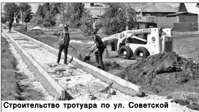
Строительство тротуара по ул. Советской