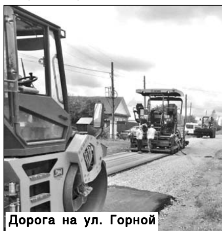
Дорога на ул. Горной

- Хотелось бы еще поговорить о кадровой проблеме. Ведь в этом году мы еще не упоминали о ней, и мало кто знает, что есть небольшие положительные сдвиги в ее решении?