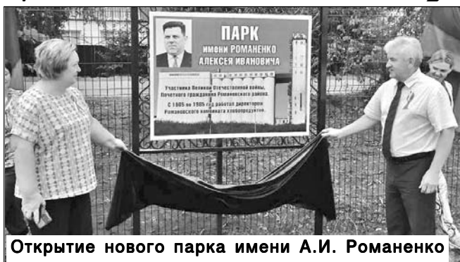
Открытие нового парка имени А.И. Романенко

Продолжается строительство тротуаров. Регионом выделено району 5 млн рублей, на эти средства ведется строительство тротуара по ул. Советской.