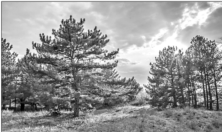
Совместный проект с Саратовской областной газетой «Регион 64».

- Обращались в федеральный центр с просьбой сделать лес предметом охраны. Предложение поддержали, что позволит сохранить и развивать эту территорию, - отметил глава региона.