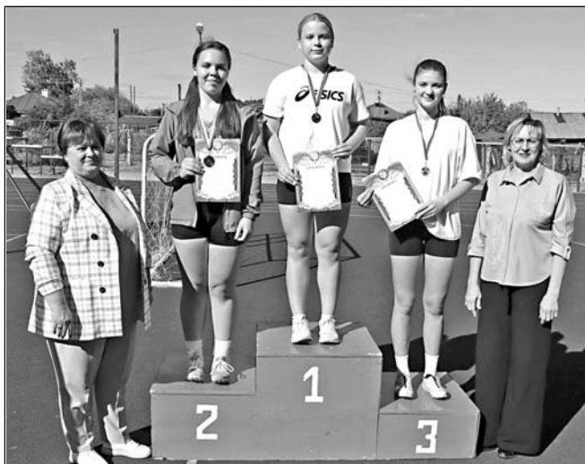
Бег 60 метров (2010-2011 г.р.)