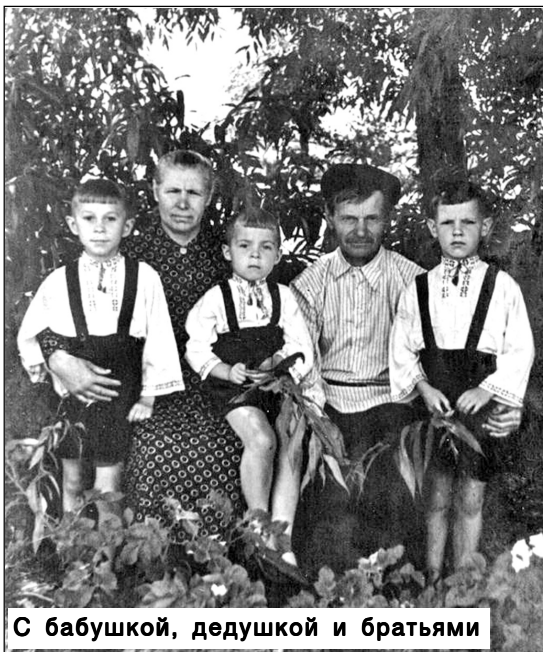
С бабушкой, дедушкой и братьями