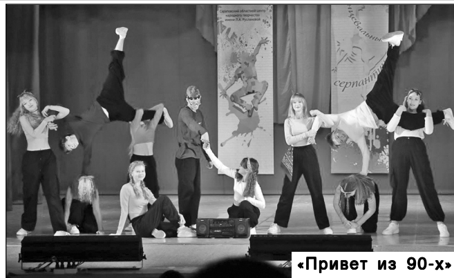
«Привет из 90-х»

Талантливые исполнители тельными эмоциями. Слои заряд из танцев и музыки вом, как и задумывали организаторы - настоящим праздником для всех. Из публикаций в сети: «В теплой и дружеской обстановке зрители Центра народного