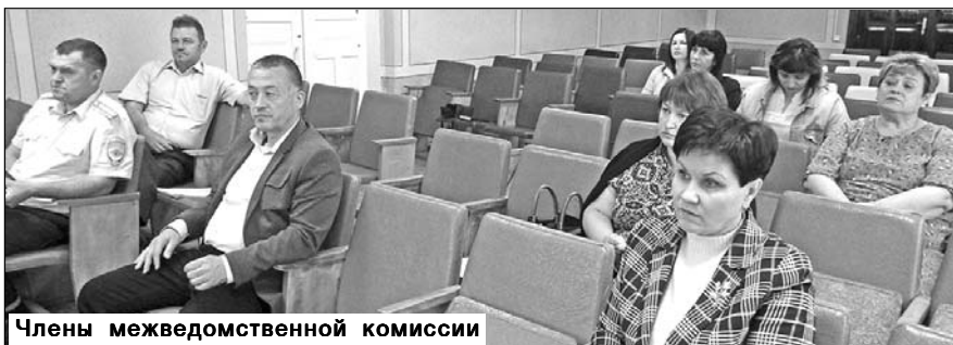
Члены межведомственной комиссии