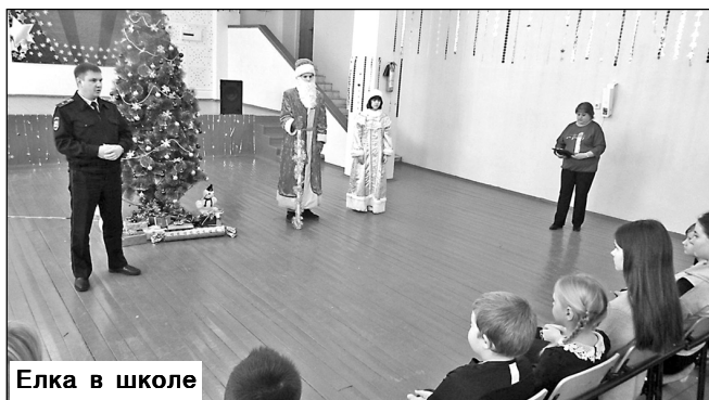
Елка в школе

Существует ли Дед Мороз, задаются вопросом дети? А что вы скажете, если есть даже Полицейский Дед Мороз? Неужели не верите, а зря. Перед Новым годом он вместе со своей внучкой Снегурочкой побывал в гостях в Романовской школе. Поздравил с наступающим Новым годом, подарил подарки.