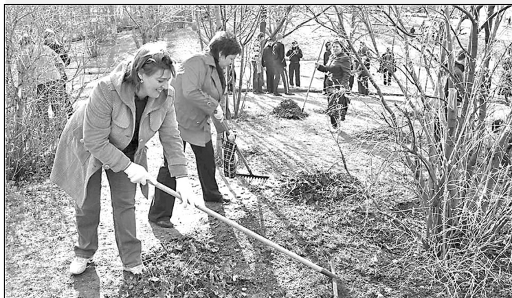
Совместный проект с Саратовской областной газетой «Регион 64».

Главам районов поручено также держать на особом контроле своевременный вывоз ТБО, поскольку в весенний период значительно увеличивается количество растительных отходов на контейнерных площадках. С регоператором достигнута договоренность, что такие отходы вывозить будут их подрядные организации.