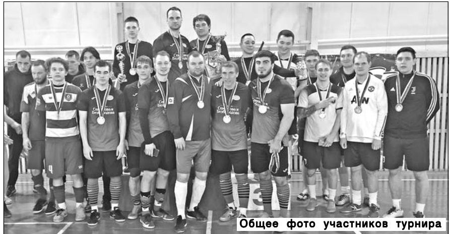
Общее фото участников турнира

Несмотря на горячую спортивную борьбу, физическую нагрузку и давление со стороны болельщиков, участники турни-