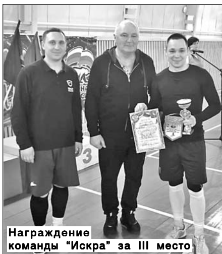
Награждение команды «Искра» за III место

Во время матчей команды, настроенные на победу, добивались поставленной цели на протяжении всей игры. Атаки и контратаки на ворота соперников проводились с завидной регулярностью, что приводило к увеличению счета и подогревало болельщиков. Темпераментные болельщики активно поддерживали свои команды. В последнем матче между принципиальными соперниками - командами ФК «Мельница» и «Аркадак»