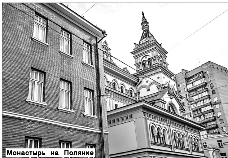
Монастырь на Полянке